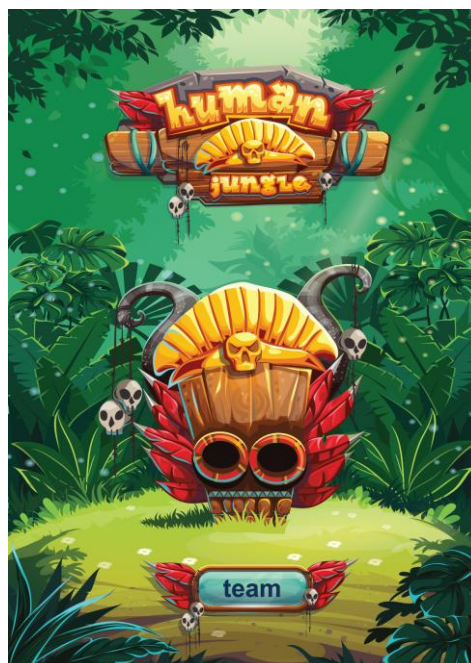
Human Jungle – Team