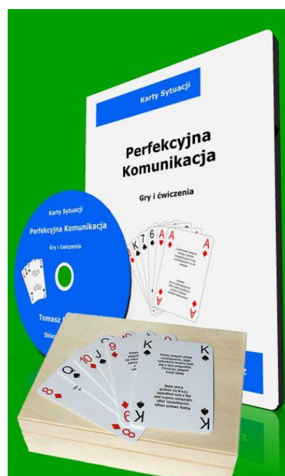
Perfekcyjna Komunikacja – Karty Sytuacji

Więcej informacji o grach na stronie internetowej: