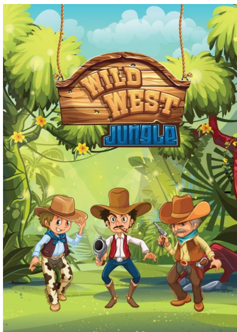
Wild West Jungle – Kowboje budują zespół